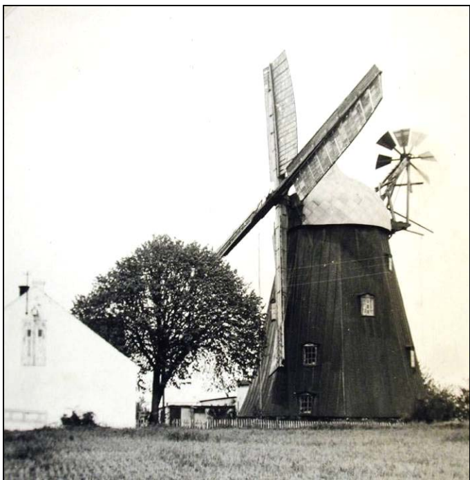
Foto 1936. Da møllen stadig var i funktion.

Møllesiderne er blevet papklædt, med der er endnu nogle mindre arealer med spån.