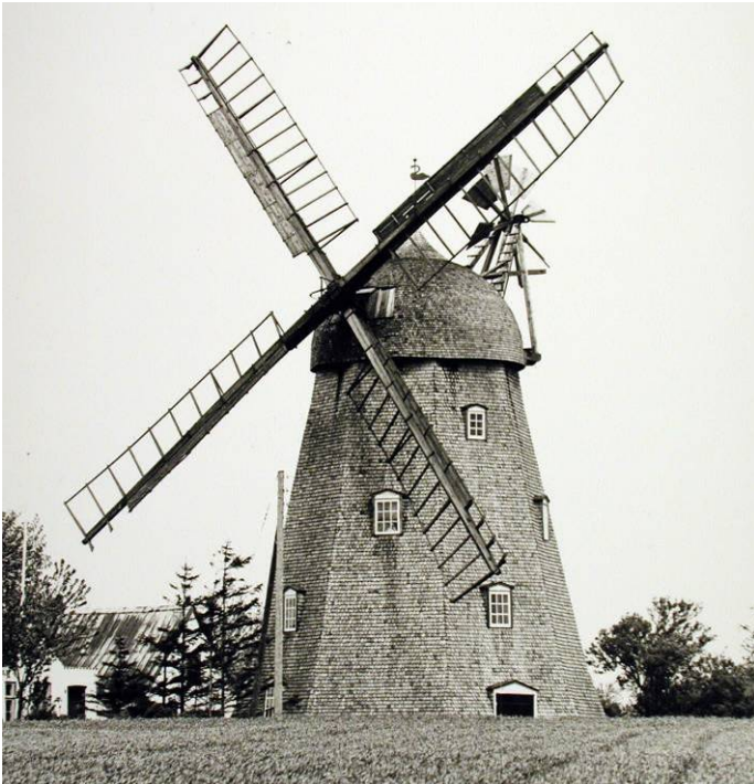
Foto 1972, nogle år efter der var kommet nye spåner på hele møllen.

1966-67 havde byforeningen samlet så mange midler sammen, at møllens papbeklædning, som efterhånden var meget utæt, kunne fjernes og møllen fik nye spåner på hat og møllekroppen, og vindrosen blev fornyet.